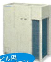
ビル用 マルチエアコン