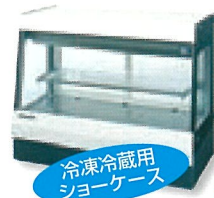
冷凍冷蔵用 ショーケース