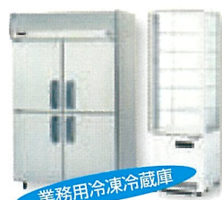
業務用冷凍冷蔵庫